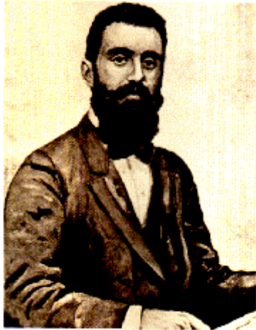
Theodor Herzl Osnivač Zionizama

Јевреј је имао један персонaлни однос између себе и земље Израиља. Он је остао, у срцу, један грађанин Јерусалима. Усред прогнанства, покоља и одбацивања, он је сањао о новом друштву у коме он може да живи у миру и безбедности. У времену, Јеврејске патње у туђим земљама дало је повода за подизање покрета за повратак у Палестину.