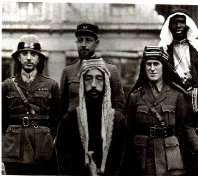
Prince Faisal (odpozada) T.E. Lawrence (desno)

Араби ће бити слободни на покон свега, да формирају своју судбину!